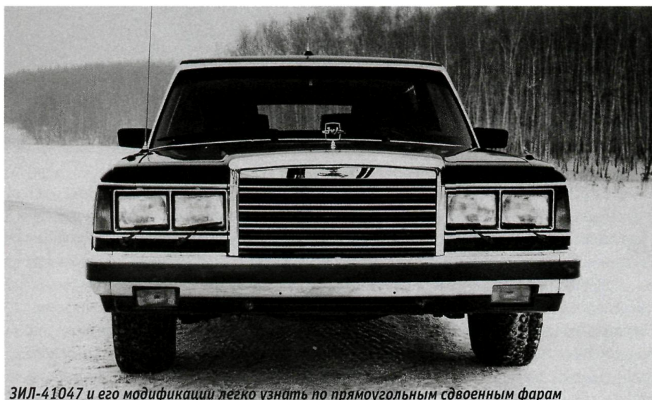
ЗИЛ-41047 и его модификации легко узнать по прямоугольным сдвоенным фарам

Управление всеми стеклоподъемниками, а также центральным замком, блокировавшим все двери, осуществлялось и с водительского места. На центральной консоли расположились блоки управления сигнальной установкой, громкоговорителем и кондиционером, а также штатная аудиосистема.