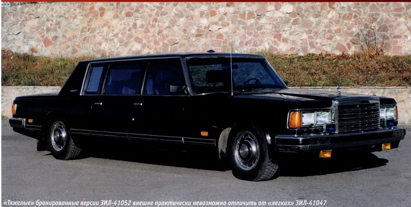
«Тяжелые» бронированные версии ЗИЛ-41052 внешне практически невозможно отличить от «легких» ЗИЛ-41047

Между передними сиденьями находился бокс для аппарата спецсвязи. Установленные в глубоких круглых «колодцах» с козырьками тахометр и спидометр были прикрыты стеклами конусовидной формы, что исключало появление солнечных бликов. Стоит упомянуть и о пневмоприводе центральной блокировки замков, а также об электроприводах регулировки наружных зеркал заднего вида и управления выдвижной антенной.