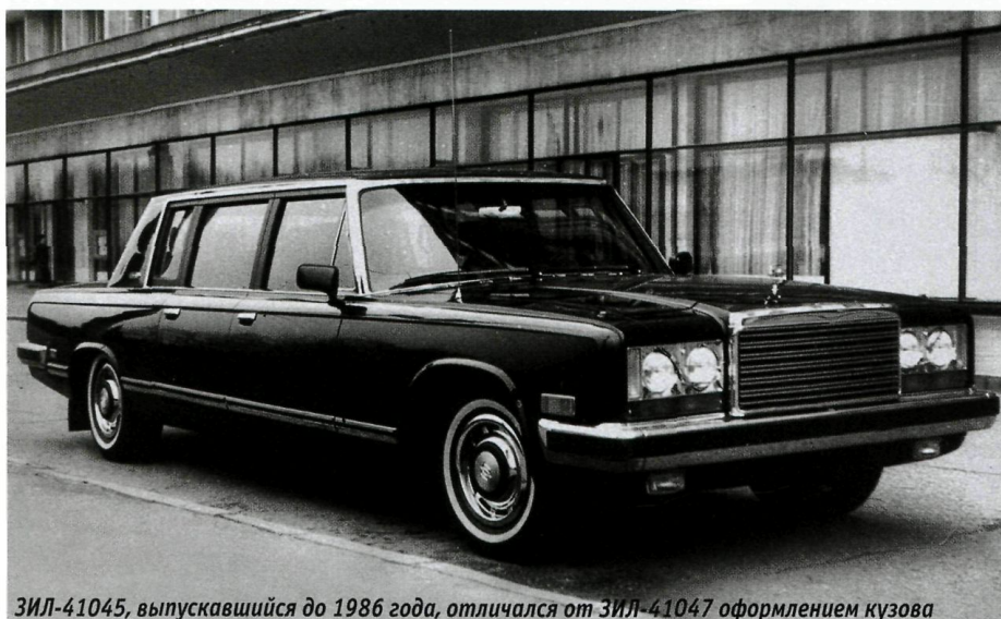
ЗИЛ-41045, выпускавшийся до 1986 года, отличался от ЗИЛ-41047 оформлением кузова

При создании автомобиля представительского класса особое внимание традиционно уделялось оборудованию и отделке салона. По сравнению с предшественниками интерьер салона ЗИЛ-41047 практически не изменился. В семиместном лимузине с тремя рядами сидений средний ряд образовывали стропонтены, убирающиеся в перегородку между передними сиденьями и «VIP-салон» задней половины пассажирского отсека. Как и прежде, для удобства посадки водителя регулируемая рулевая колонка откидывалась вверх, а два