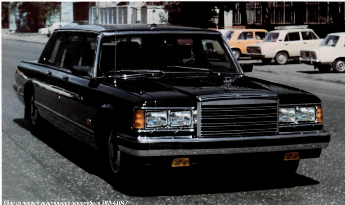
Один из первых экземпляров автомобиля ЗИЛ-41047

В 1988 году гидромеханическая передача (ГМП), унаследованная «сорок седьмым» от своего предшественника ЗИЛ-41045, подверглась модернизации: была изменена конструкция муфты свободного хода и нескольких прилегающих деталей, что увеличило надежность узла. Обновленному агрегату присвоили индекс «4105-01». ЗИЛ-41047 получил 16-дюймовые колеса и еще более широкую (245 мм) «резину». Шины особой марки «Гранит» имели конструкцию, позволявшую двигаться при «разгерметизированном» колесе, что достигалось за счет очень жестких боковин покрышки и находящегося внутри специального геля. Такая шина способна выдерживать до семи пулевых попаданий.